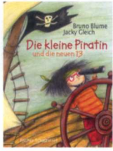
B. Blume, J. Gleich: „Die kleine Piratin und die neuen 13“, Fischer, ab 3