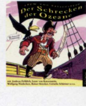
L. v. Katzenstein: „Der Schrecken der Ozeane“, Hörcompany