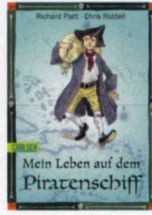
R. Platt, Chr. Ridell: „Mein Leben auf dem Piratenschiff“, Carlsen, ab 10