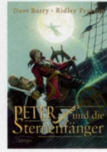
D. Barry, R. Pearson: „Peter und die Sternenfänger“, Oetinger, ab 10