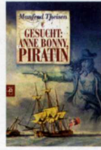
M. Theisen: „Gesucht: Anne Bonny, Piratin“, cbt, ab 12